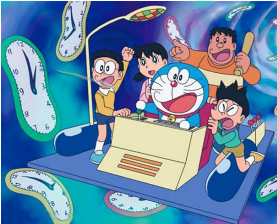
附圖(二) 哆啦 A 夢帶著大家乘坐時光機 https://kknews.cc/comic/mo46avp.html